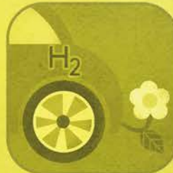
Auto a Idrogeno