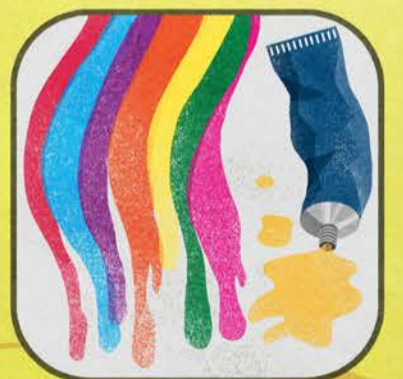
Vernici Inchiostri Adesivi