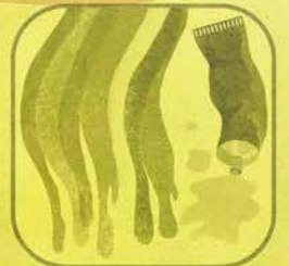
Vernici Inchiostri Adesivi