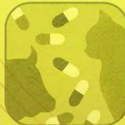
Farmaci per Animali